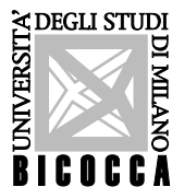
Università degli Studi di Milano Bicocca