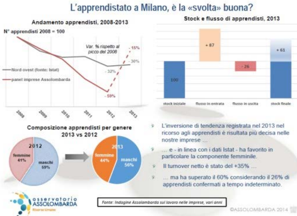
Grafico 2 – Il ricorso alla flessibilità