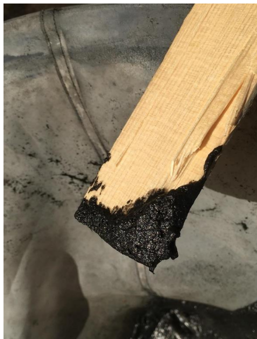
Particolare di residuo da filtrazione